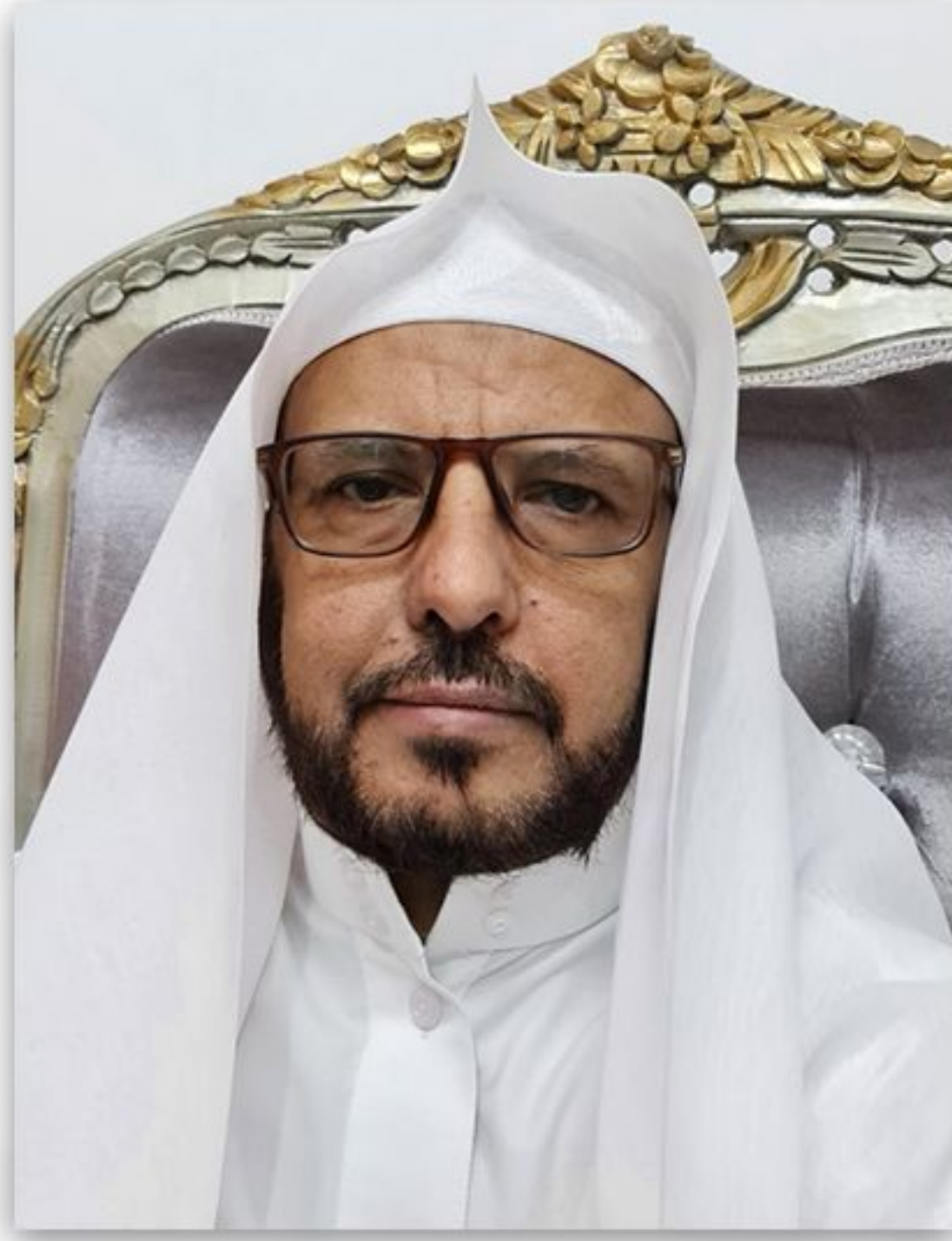
الشيخ أحمد بن مهدي القطوي